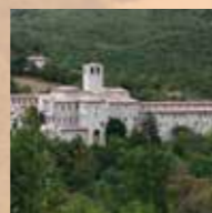
Klooster Fonte Avellana