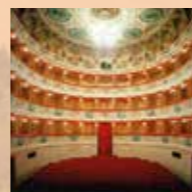
Theater Feronia in San Severino Marche