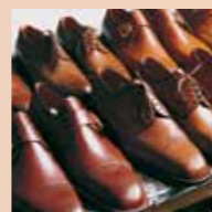
Talloze outlets in de regio