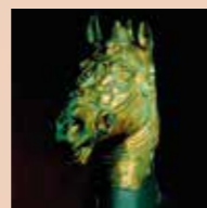
Museum van de Bronzi Dorati in Pergola