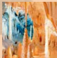
Grotten van Frasassi bij Genga