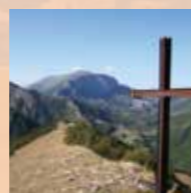
Natuurpark Monte Cucco