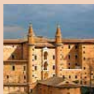
Palazzo Ducale in Urbino