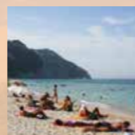
Strand bij de Monte Conero